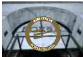
AIM – PROSEGUE LA CORSA DI SITI B&T