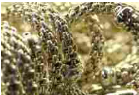
FOPE (AIM) – PROTAGONISTA AL 'LUXURY SHOW' DI LAS VEGAS