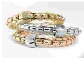
FOPE (AIM) – I SOCI APPROVANO IL BILANCIO 2016